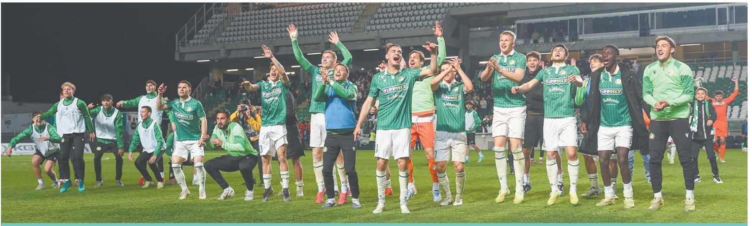
Vasárnap 1–0-ra nyert az ETO az FTC ellen, szerdán hosszabbítás után, tizenegyesekkel kapott ki.